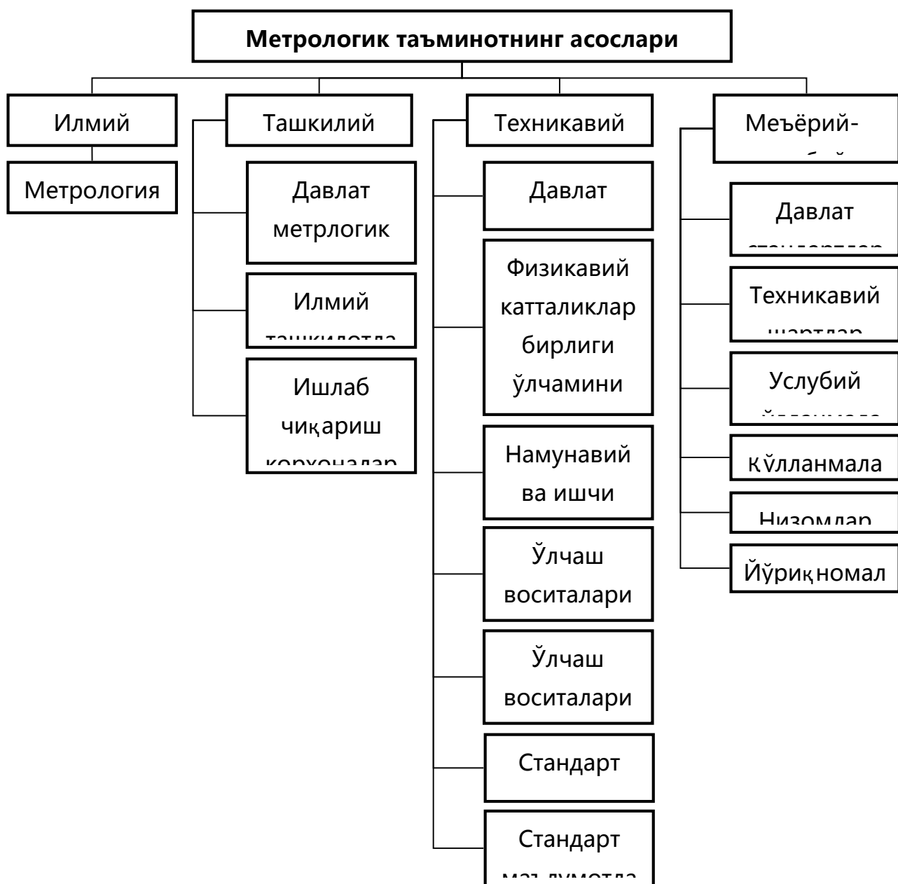
1 1-расм Метрологик таъминот асослари

4. Меъёрий-услубий (қонуний) асослари - тегишли республика қонунлари, давлат стандартлари, давлат ва тармоқларнинг меъёрий ҳужжатлари.