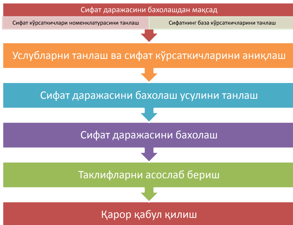
1- расм. Махсулот сифати даражасини баҳолаш босқичлари

Махсулотнинг сифати даражасини баҳолаш махсулот сифатини системасида зарурий бошқарув таъсирини амалга оширишда асос бўлиб хизмат қилади. Умумий кўринишида махсулот сифатини баҳолаш куйидаги босқичларда амалга оширилиши мумкин (1-расм).