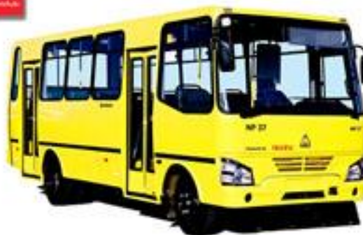
37 va 26 o'ringa mo'ljallangan yo'lovchi tashuvchi avtobus.