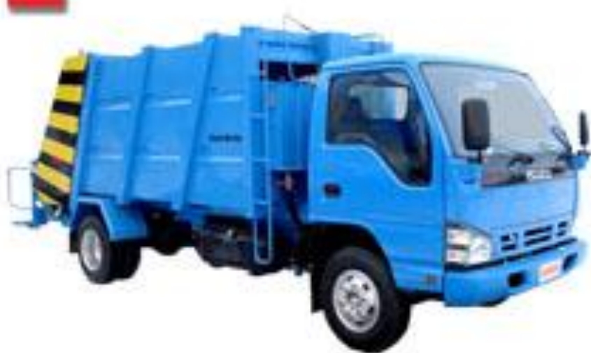
Axlat tashuvchi avtomobili.