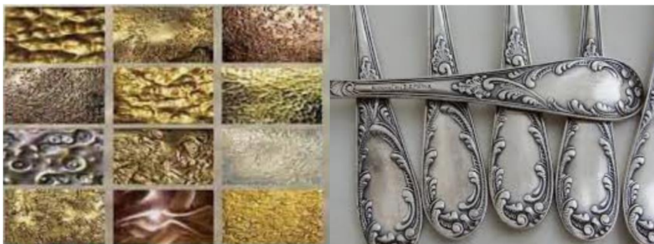
3 – rasm. Melxior qotishmasining ko'rinishi

(rux taxminan 20% gacha) rangi, oltin qotishmalarining rangiga ancha o'xshash bo'ladi. Ulardan turli sovg'a, sport ko'krak nishonlari, badiiy idishlar va arzon taqinchoqlar tayyorlashda keng qo'llaniladi. Bronza – mis qalay qotishmasi bo'lib, qalayning miqdori 3 – 12% oralig'ida bo'ladi. Qotishmaning mo'ljallangan vazifasiga qarab, uning tarkibiga: rux, qo'rg'oshin, fosfor, nikel qo'shiladi. Qalayli bronzalardan tashqari alyuminli, kremniyli, berilliyli, kadmiyli bronzalar ham mavjud [3]. Bronzaning zichligi 7,5 – 8,8 g/sm 3 , erish harorati 1010 – 1140 0 C. Qalayli bronzalarning quymakorlik xususiyatlari yuqori bo'lganligi sababli, badiiy quymalar olishda keng qo'llaniladi. Badiiy ishlov berishda, berilliyli bronzalar keng qo'llaniladi, chunki ularning qattiqligi va mustahkamligi yuqori, korroziyaga esa ancha chidamli hisoblanadi. Melxior – mis nikel qotishmasi bo'lib, tarkibida 18-20% oralig'ida nikel bo'ladi. Bezaklovchi qotishmalar turiga kiradi va yoqimli kumush rangida tovlanadi. Korroziyaga mustahkamligi yuqori. Plastikligi yaxshi bo'lganligi sababli: shtamplab, zarb etilib, kesilib, kavsharlanib va jilolanib mahsulot tayyorlashda keng foydalaniladi. Melxiordan tayyorlangan mahsulotlarning mustahkamligi yuqori bo'ladi. Melxiorning zichligi 8,9 g/sm 3 atrofida, erish harorati 1170 0 C. Melxiorning xususiyatlari – kumushning xususiyatlariga o'xshash bo'lganligi sababli, melxiordan katta miqdorda oshxona anjomlari va arzon taqinchoqlar tayyorlanadi.