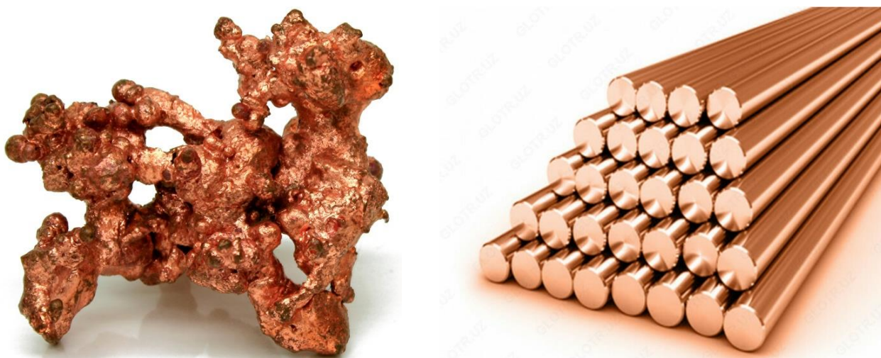
1 – rasm. Mis qotishmalarining ko'rinishi

Mis (Cu) – qizg'ish ko'rinishidagi metall bo'lib, yuqori plastiklik va oquvchanlik xususiyatiga ega. Misning zichligi 8,96 \text{ g/sm}^3 , erish harorati 1083^{\circ}\text{C} , issiqlik va elektr o'tkazuvchanlik xossasi yaxshi. Yumshoq bo'lganligi sababli kesuvchi asbobda ishlov berish murakkabroq, lekin yaxshi jilolanadi. Mis ochiq havoda oksidlanadi va bu oksid qatlami uni emirilishdan saqlaydi. Mis azot kislotasida va sulfat kislotasining eritmasida, harorat ortishi bilan engil eriydi. Xlorid kislotasida esa, kislorodning ishtirokida eriydi. Mis, qulay fizikaviy va mexanik xususiyatlarga ega bo'lganligi sababli, sanoatda juda keng qo'llaniladi.