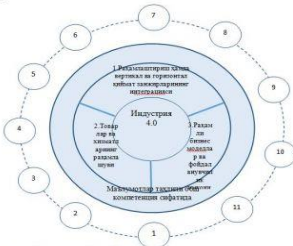
1-чизма. “Индустрия 4.0” ва йўллов технологиялар.

Рақамли иқтисодийёт дискурс ва реаллик туташувида пайдо бўлган моделга мисол ҳисобланади. У иқтисодий ўсишнинг жиддий илгари силжишларга олиб келишга ҳамда қатор бизнес соҳалари, меҳнат бозори ва кишиларнинг турмуш тарзига таъсир кўрсатишга қодир ҳаракатлантирувчи кучи сифатида эътироф этилади. Рақамли иқтисодийёт ривожланаётган мамлакатларда катта салоҳиятга эга бўлиб, улар учун бундай иқтисодий олға силжишлар иқтисодий ўсиш, капитал ва меҳнат унумдорлиги ривожланиши, транзакцион харажатларни қисқартириш ҳамда жаҳон бозорларига кириш имконияти кенгайтириши мумкин. Бу кутилмалар маълум даражада асосланган: ривожланаётган мамлакатларда рақамли иқтисодийётнинг улуши ҳар йили 15-25 фоизга ўсиб бормоқда.