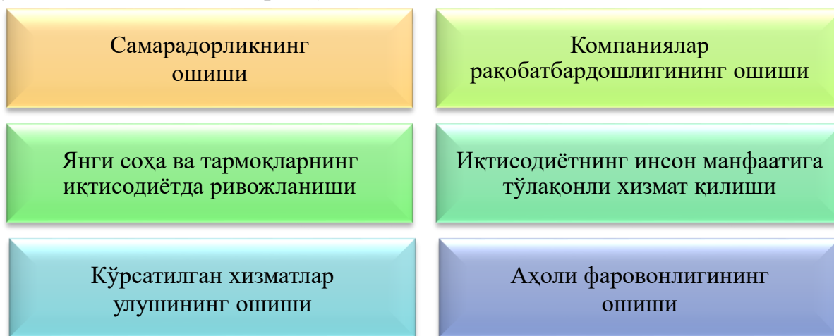
1.3-расм. Рақамли иқтисодиётнинг афзалликлари

Рақамли иқтисодиёт кўплаб иштирокчилар билан бозорларда ва ахборот-коммуникация технологиялари соҳасида хизмат кўрсатишнинг юқори даражасига эга бўлган бозорларда самарали фаолият кўрсатмоқда. Аввало, бу Интернет тармоғига боғлиқ: транспорт, савдо, логистика ва бошқалар. Электрон сегментнинг улуши ялпи ички маҳсулотнинг қарийб 10 фоизини, бандликнинг 4 фоизидан ортиғини ташкил қилади ва бу кўрсаткичлар тобора ошиб бораётган тенденцияга эга. Рақамли иқтисодиёт глобал иқтисодий тизимнинг таркибий қисмини – истеъмолчиларнинг имкониятларини, sanoat тузилмасини, давлатларнинг ролини тубдан ўзгартиради. Рақамли иқтисодиётнинг кенг жорий этилиши ишлаб чиқариш самарадорлигининг ортишида, янги тармоқ ва соҳаларнинг ривожланишида, хизматлар сифати ва уларни кўрсатишнинг оптималлашишида, иқтисодиётнинг инсон манфаатларига хизмат қилиши ва бу орқали ҳаёт сифатининг яхшиланишида муҳим ҳисобланади (1.3-расм).