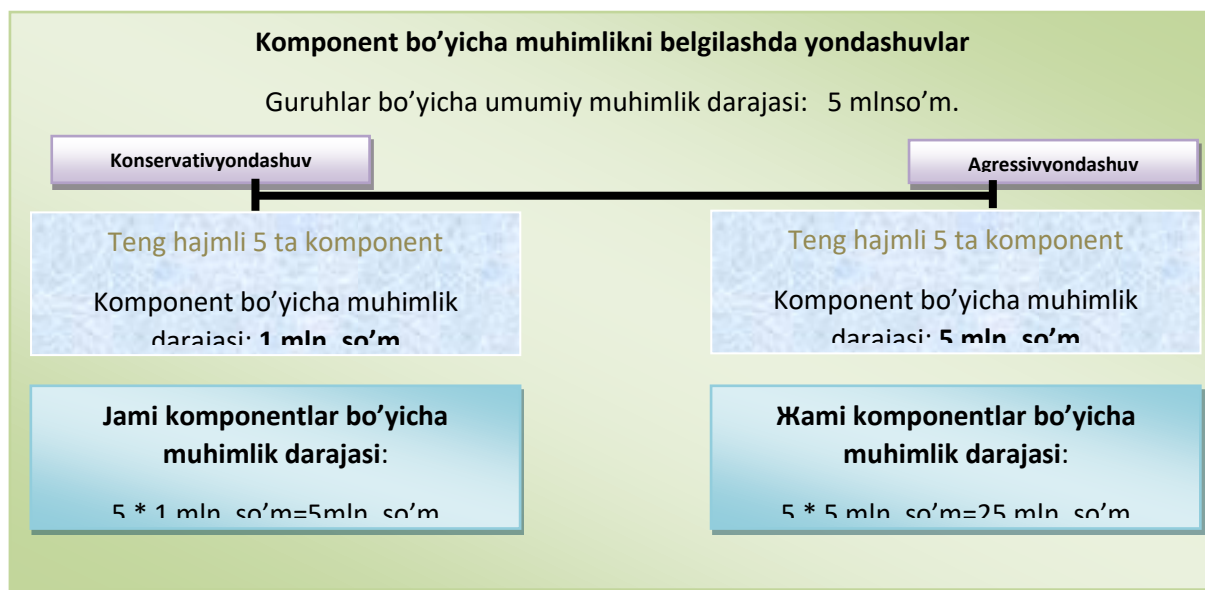
8-chizma. Komponent bo'yicha muhimlikni belgilashda yondashuvlar

Konservativ yondashuv bo'yicha guruhlar bo'yicha umumiy muhimlik darajasi 5 mln. so'm 5 ta komponentga oddiy arifmetik taqsimlash yo'li bilan taqsimlanadi. Bizning misolimizga muvofiq sho'ba korxonalar hajm jihatdan teng bo'lganligi munosabati bilan ularning xar biriga muhimlik darajasini 1 mln. so'm qilib belgilaymiz. Agar biz o'rganayotgan komponentlar hajm jihatdan xar xil bo'lganda ham guruh uchun umumiy muhimlik darajasi 5 mln. so'mni tashkil etgan bo'lar edi, ammo uni komponentlarga taqsimlash har bir komponentning salmog'iga mutanosib ravishda taqsimlanar edi.