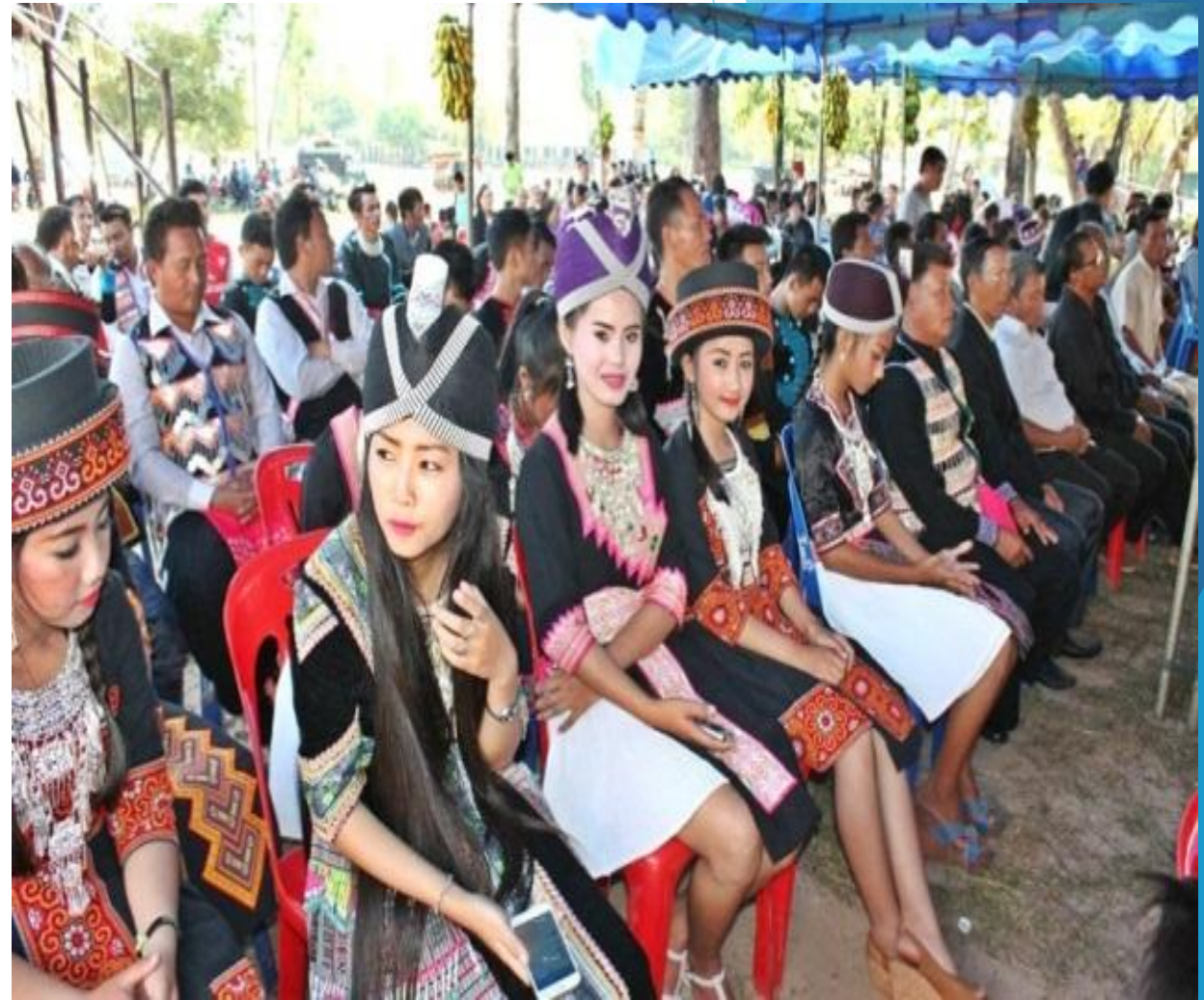
ອ້າງຈາກ: ພູວິງ ໜໍ່ດາລາ ແລະຄະນະ (2018)

➤ ເທບນິຍາຍ “ການສ້າງໂລກ” ຂອງເຜົ່າ ມັງເວົ້າວ່າ: ແຖນໄດ້ເອົາດິນມາປັ້ນເປັນ ຄົນ. ມະນຸດກໍແມ່ນວັດຖຸຊະນິດໜຶ່ງ. ດັ່ງນັ້ນ, ມະນຸດກໍເກີດຈາກດິນ ເຊິ່ງແມ່ນ ວັດຖຸບ່ອນເພິ່ງພາອາໄສຂອງມະນຸດ ແລະ ລ້ຽງມະນຸດ, ແມ່ນແມ່ກໍາເນີດຂອງ ສັບພະສິ່ງ ແລະ ວັດຖຸອື່ນໆອີກຫຼາຍ ຢ່າງ. ດັ່ງນັ້ນ, ຊາວບູຮານຈຶ່ງຖືວ່າດິນ ເປັນສິ່ງສັກສິດອັນໜຶ່ງ.