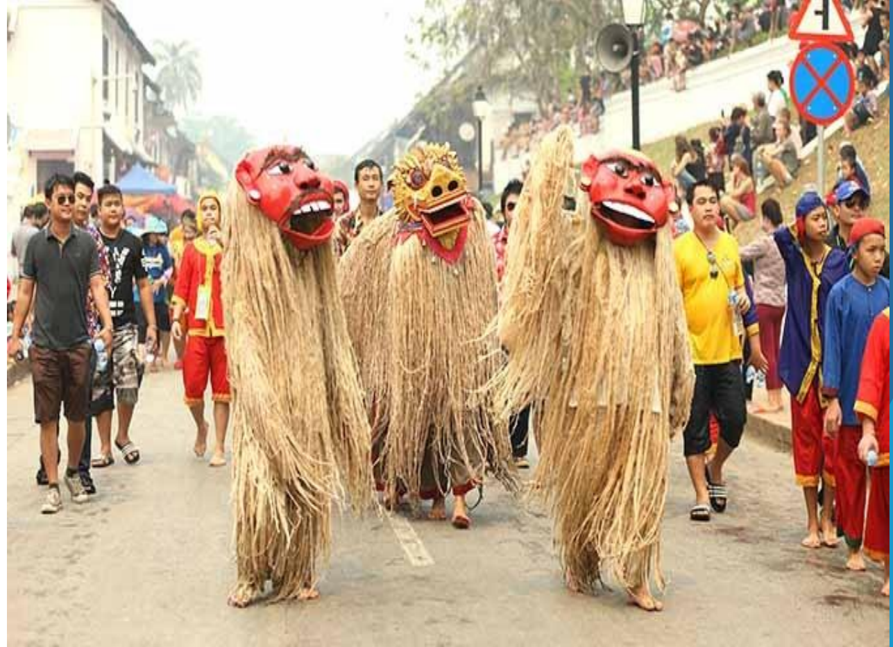
ອ້າງຈາກ: ພູວິງ ໜໍ່ດາລາ ແລະຄະນະ (2018)