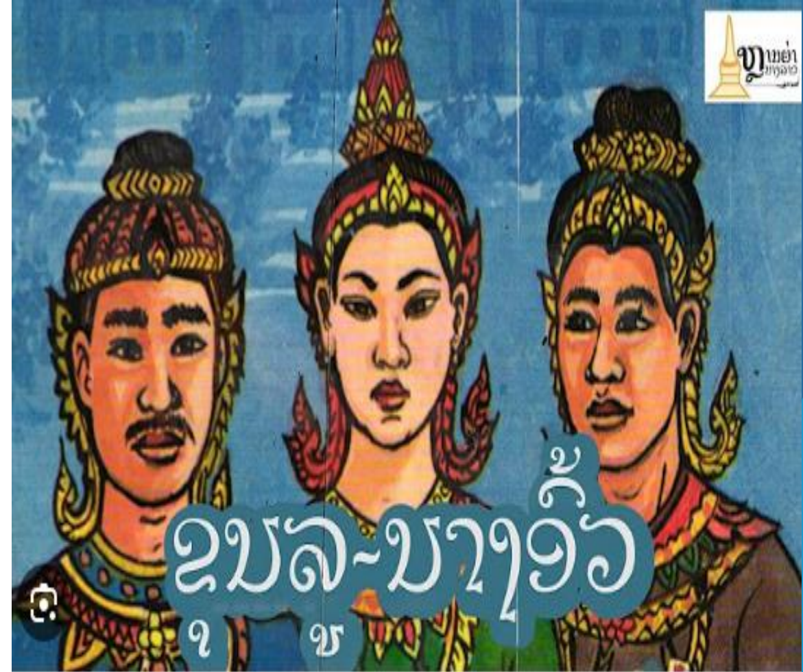
ອ້າງຈາກ: ພູວິງ ໜໍ່ດາລາ ແລະຄະນະ (2018)

➤ ນອກຈາກນີ້ ຢູ່ໃນເລື່ອງ: “ນາງອິວຕາບຟ້າ” ໄດ້ກ່າວວ່າ ສ່ວນຢູ່ໃຈກາງຂອງທະເລກໍເກີດມີພະຍຸປັ່ນປ່ວນ ຕາມປ່າເຂົາພະນອມວັນກໍເກີດໄຟໄໝ້ໄປໃນທຸກແຫ່ງທຸກຫີນ. ນ້ຳທີ່ຢູ່ໃນໃຈກາງຂອງໜ່ວຍໂລກກໍໄຫຼຟືດຂຶ້ນມາເປັນກະແສໃຫຍ່ແລ້ວເກີດເປັນຟອງໄຫຼລົງໄປໂຮມເປັນມະຫາສະໝຸດອັນກວ້າງໄກສຸດສາຍຕາ. ສິ່ງດັ່ງກ່າວໄດ້ກາຍເປັນສິ່ງສັກສິດທີ່ຕິດຕົວຢູ່ໃນແນວຄິດຂອງປະຊາຊົນມາຈົນເຖິງທຸກວັນນີ້.