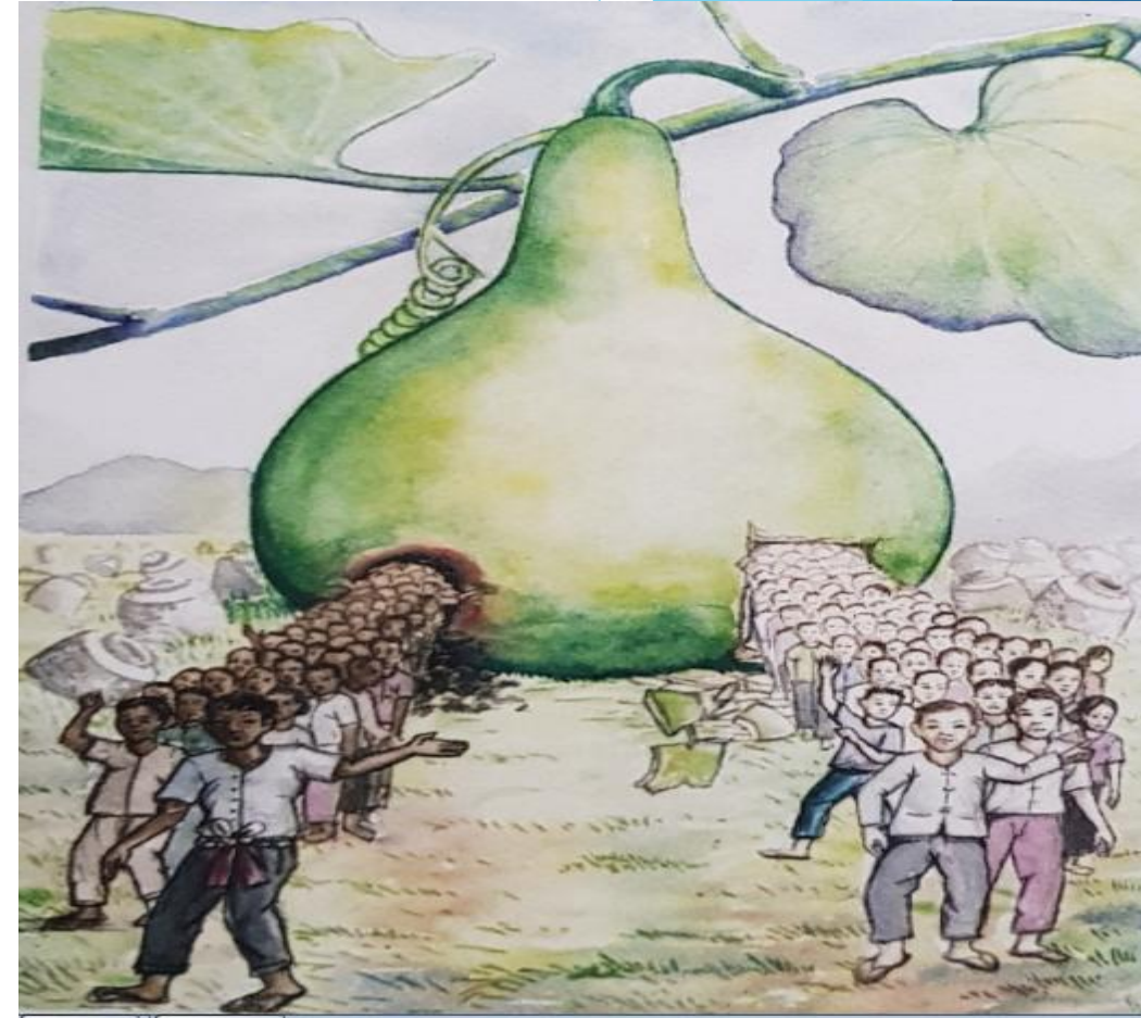
ອ້າງຈາກ: ພູວົງ ໜໍ່ດາລາ ແລະຄະນະ (2018)