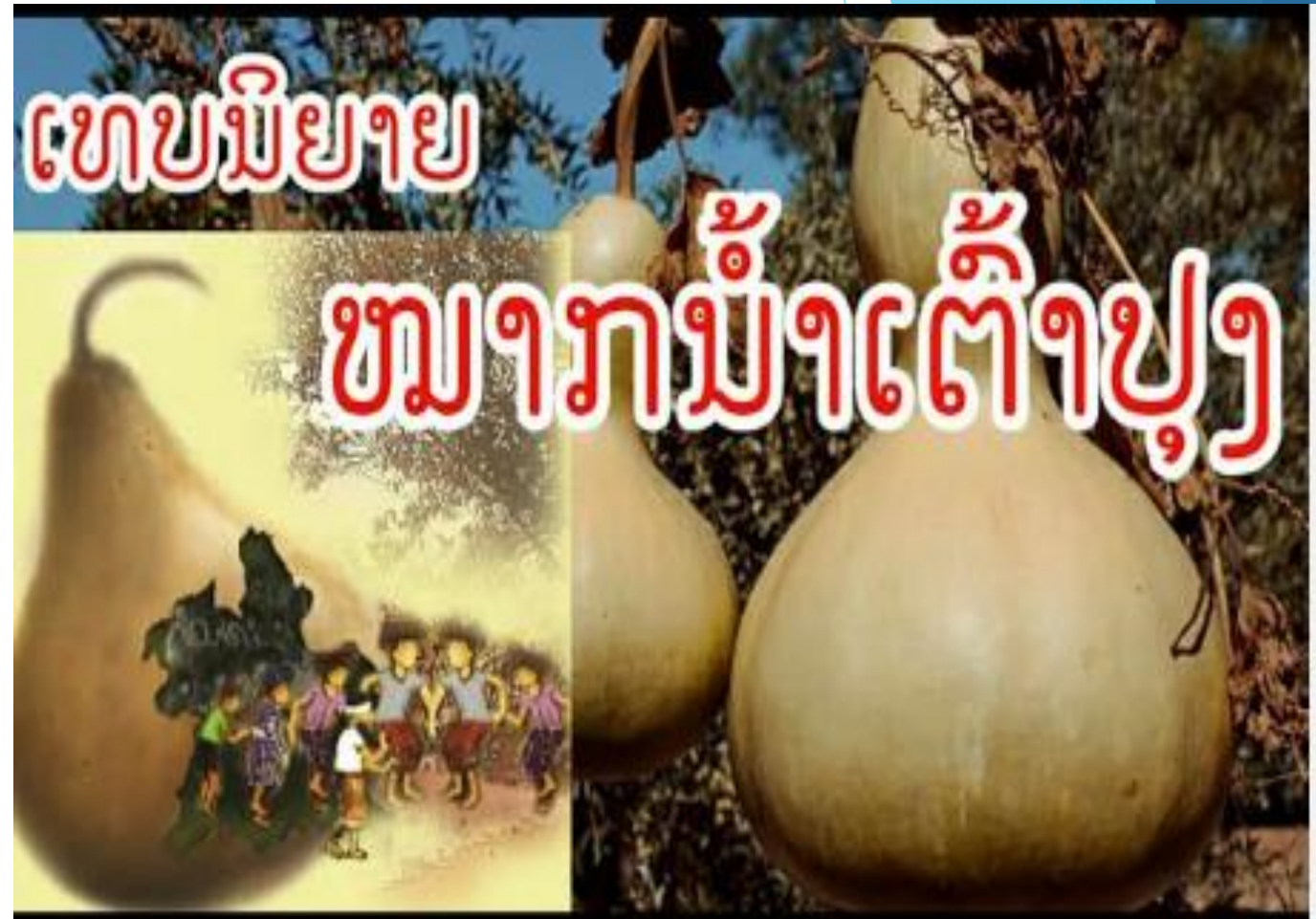
ອ້າງຈາກ: ພູວົງ ໜໍ່ດາລາ ແລະຄະນະ (2018)