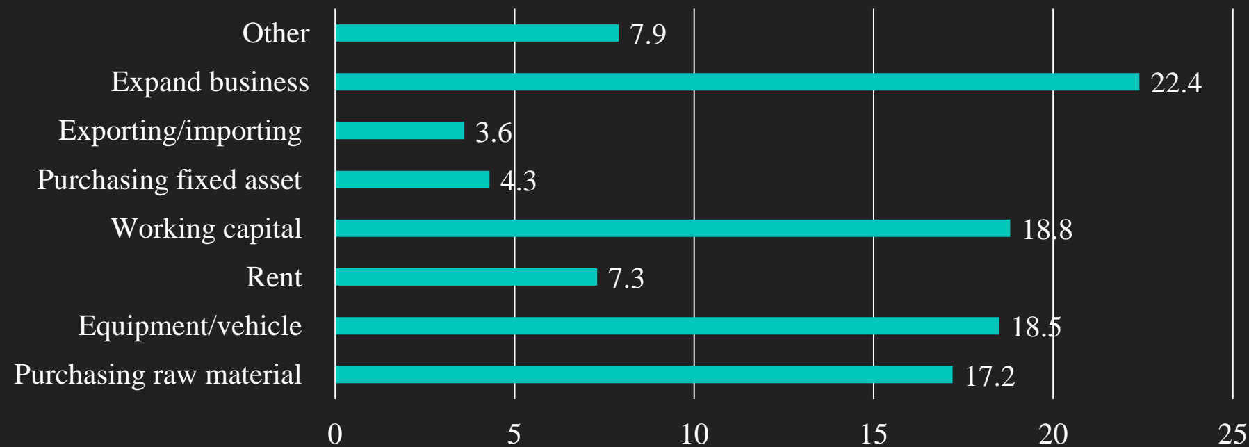
Reasons for Seeking Finance