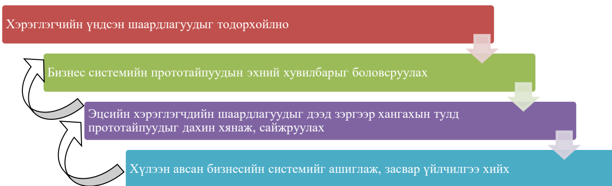
Зураг Error! No text of specified style in document.-4. Прототайпын боловсруулах үе шатууд

Жижиг ба том системүүдэд хэрэглэж болох боловч хэрэв систем том байвал прототайп нь тухайн системийн дэд хэсгүүдэд хуваагдан хөгжүүлэгдэнэ. Хурдан хөгжүүлэх арга учраас системийг хүлээн авах хүртэл дахин дахин сайжруулалтууд хийгдсээр байдаг. Прототайпын аргын хамгийн гол давуу тал бол мэдээллийн системийн эцсийн хэрэглэгчдийн интерфэйсийн хамгийн оновчтой байдлаар зохиомжлогдон гарч ирдэг бол сул тал нь системийн хөгжлийн чухал үе шатуудыг мэдэгдэлгүй өнгөрүүлж болно. Өөрөөр хэлбэл хэтэрхий интерфэйс тал дээр анхаарал хандуулснаас системийн үндсэн ажиллагааг орхигдуулах тал ажиглагддаг.