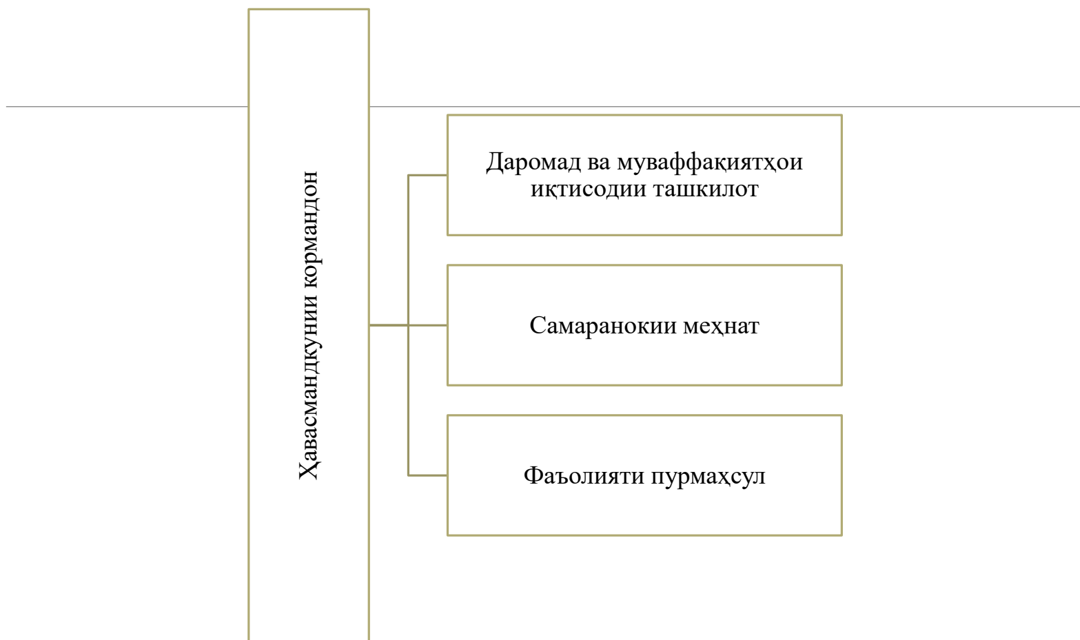
Расми 3. Идоракунии сармояи инсонӣ