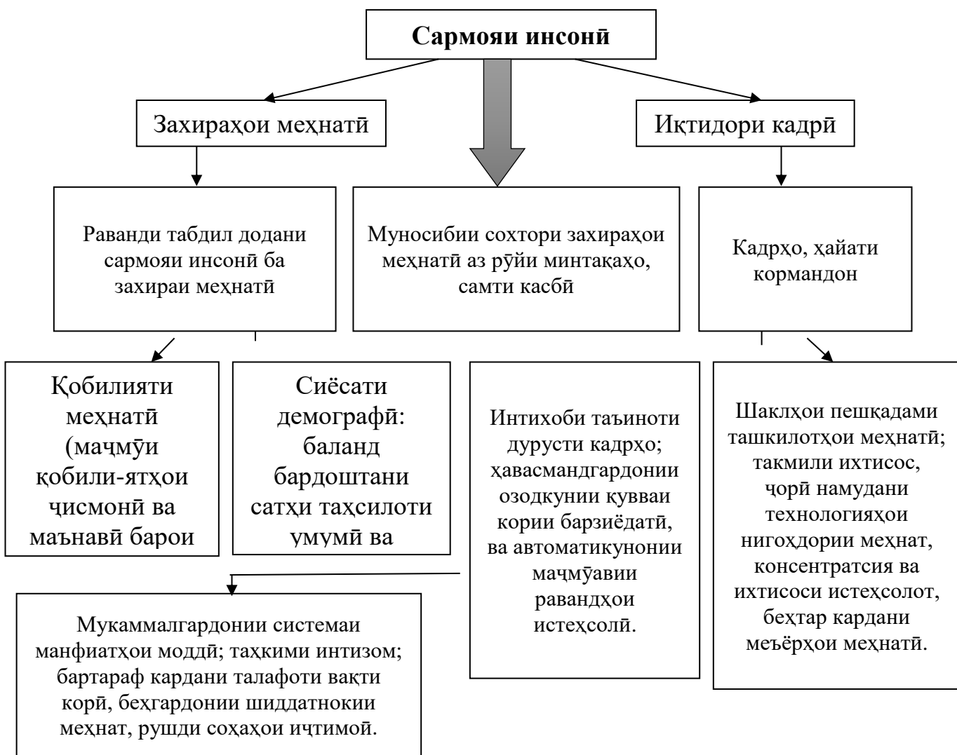
Расми 1. Сармояи инсонӣ (аз ҷониби муаллиф тартиб дода шудааст).

Сармояи инсонӣ захираи асосии истеҳсолии дар ихтиёри корхона буда, барои афзун намудани дороиҳо ва таъмини фаъолияти самарабахш хизмат менамояд. Сармояи инсонӣ маҷмӯи донишу салоҳиятҳо, сифатҳою арзишҳо, истеъдоду қобилиятҳое, ки дороию сарватмандии инсонро метавонад дучанд намояд, агар онҳоро баҳри манфиатбахши ҷомеа ва тафаккури шахсӣ сафарбар гардида бошад.