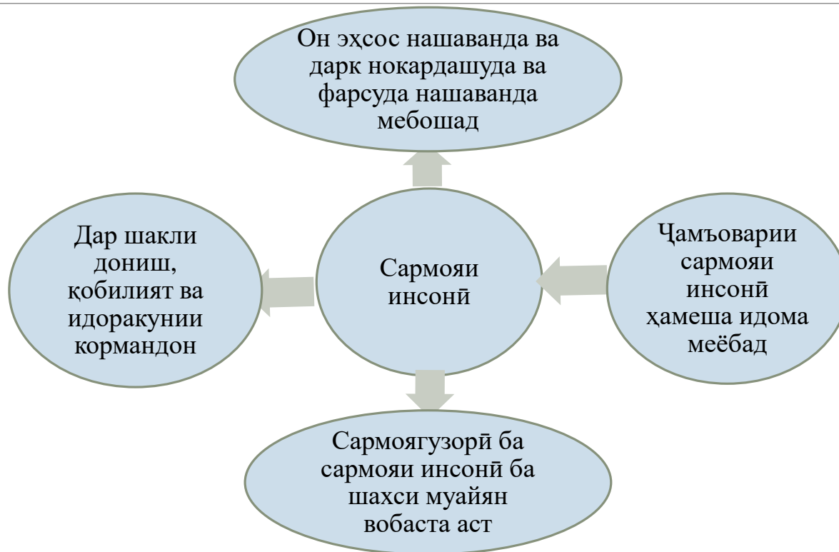
Расми 1. Хусусиятҳои асосии сармояи инсонӣ

Дар таркиби маҷмӯи сармоя, сармояи инсониро метавон ҳамчун унсурҳои он муаррифӣ намуд, яъне сохти дохилии хешро дора мебошад.