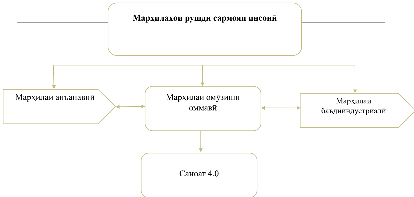
Расми 1. Омилҳои таъсиргузор ба ташаккул ва рушди сармояи инсонӣ