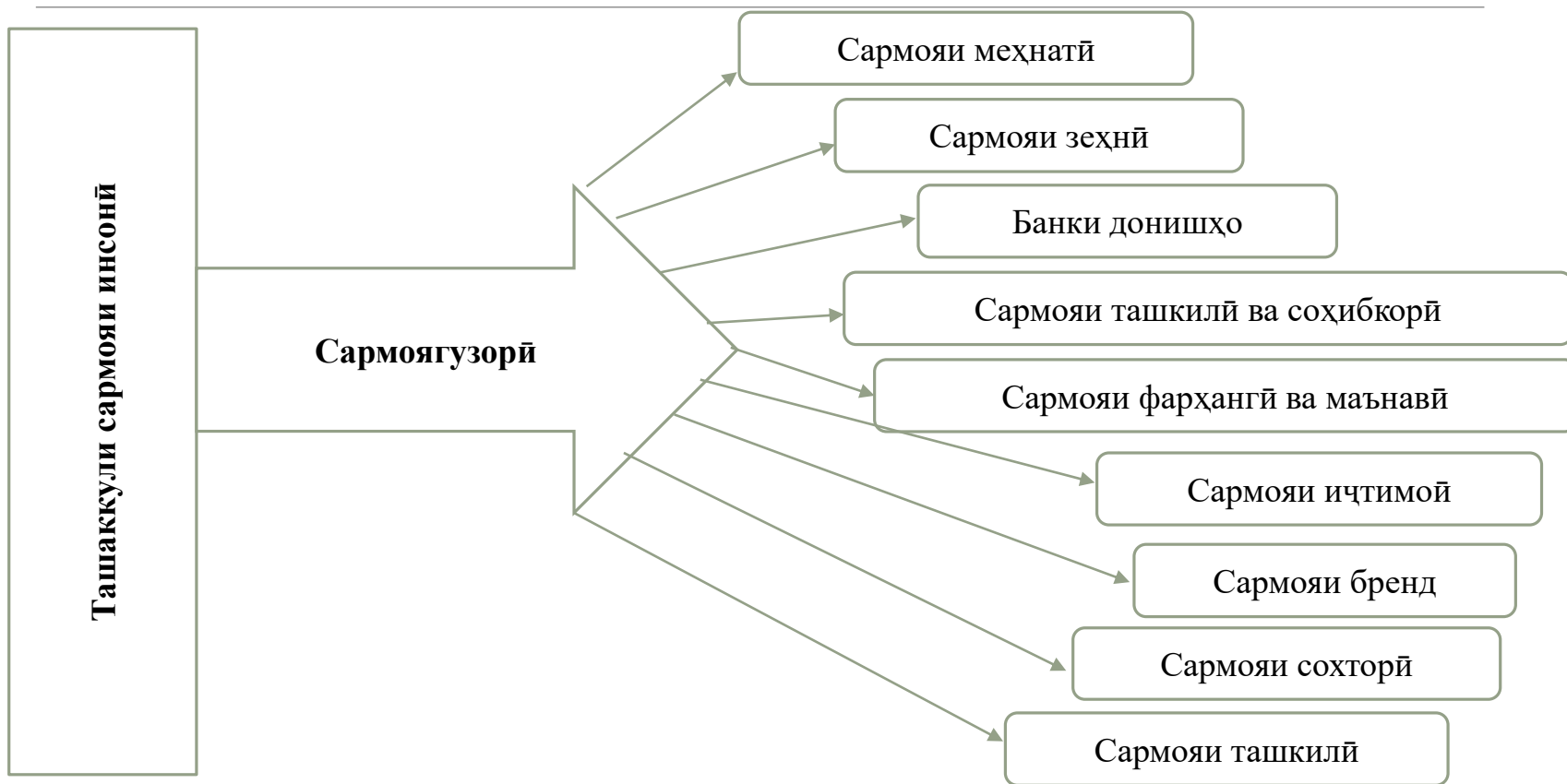
Расми 1. Ташаккули сармояи инсонӣ ва сармоягузори ба он