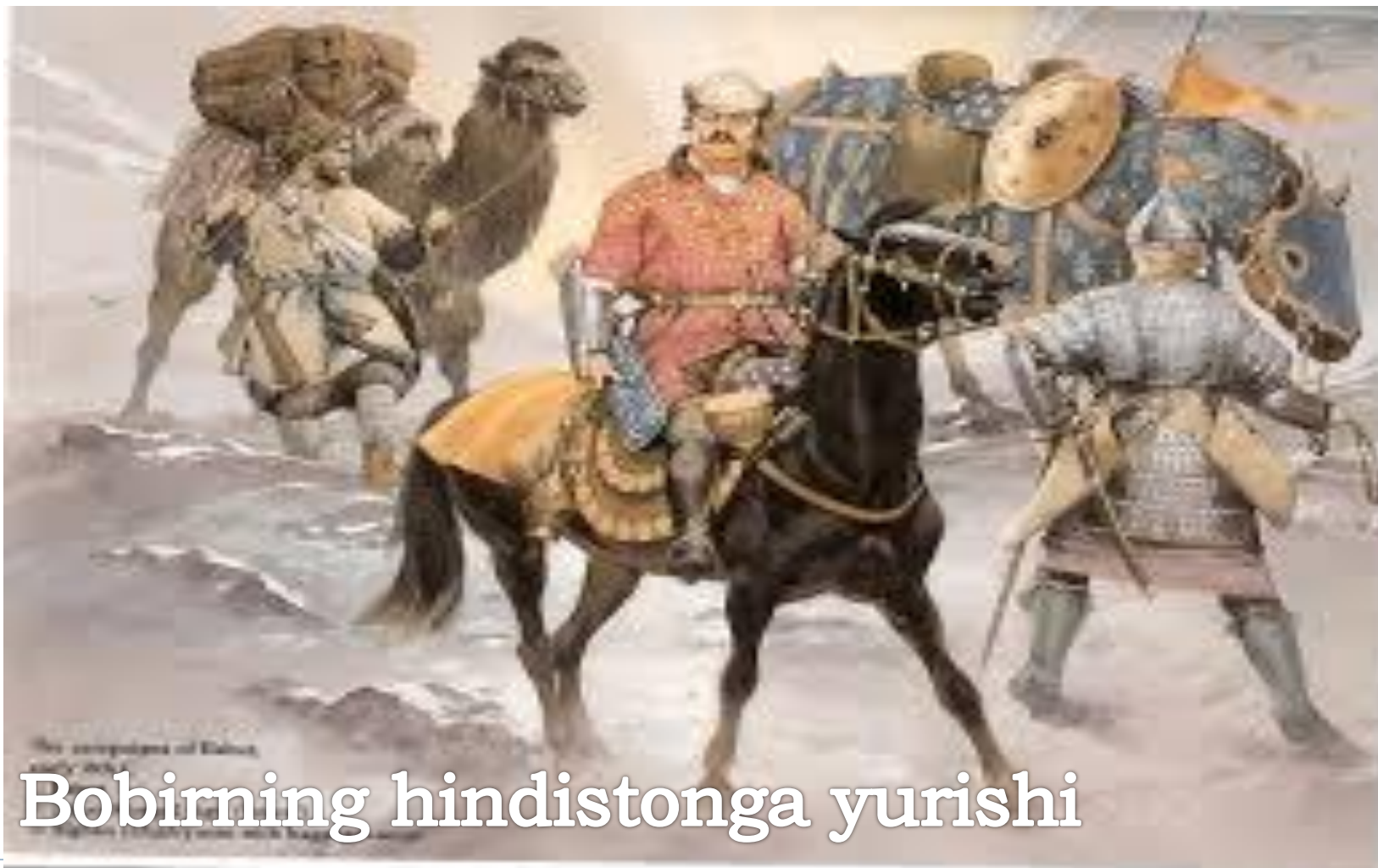
Bobirning hindistonga yurishi